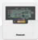
Optionale Kabelfernbedienung CZ-RD52CP